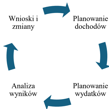
Schemat 1 Przykładowy schemat