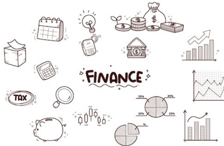
Rysunek 1 Przykładowy rysunek